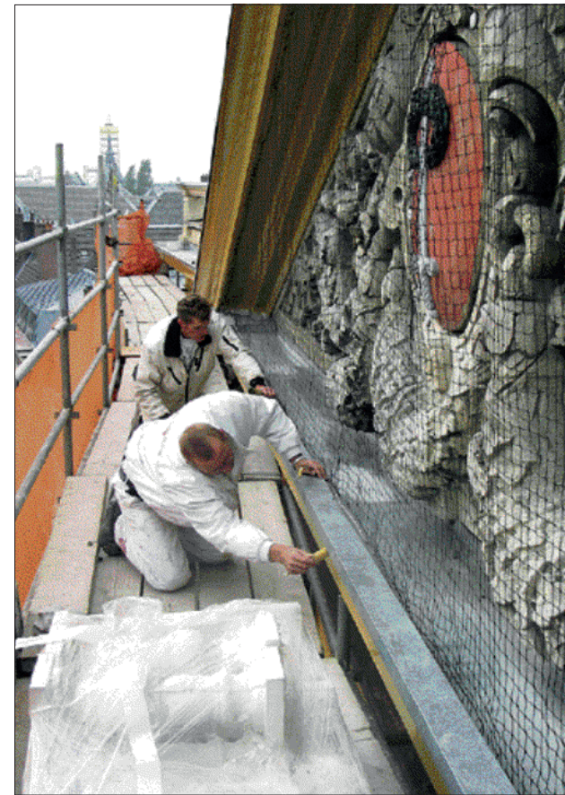
Schilders van Kranendonk schilderen de friezen rondom de timpaan aan de voorzijde van het hotel.

De schilders van Kranendonk logeerden aanvankelijk in pensions en hotels, omdat elke dag heen en weer rijden te veel tijd kost. "Een tijdje geleden hebben we een woning gekocht in Den Haag. Daar kunnen zes schilders overnachten", aldus Kranendonk.